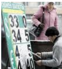
Tableau des cours croisés

EUR/USD 1.3212 -0.09% USD/JPY 79.5300 -0.32% GBP/USD 1.5873 0.06%